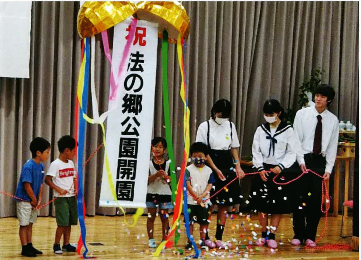
法の郷公園開園式