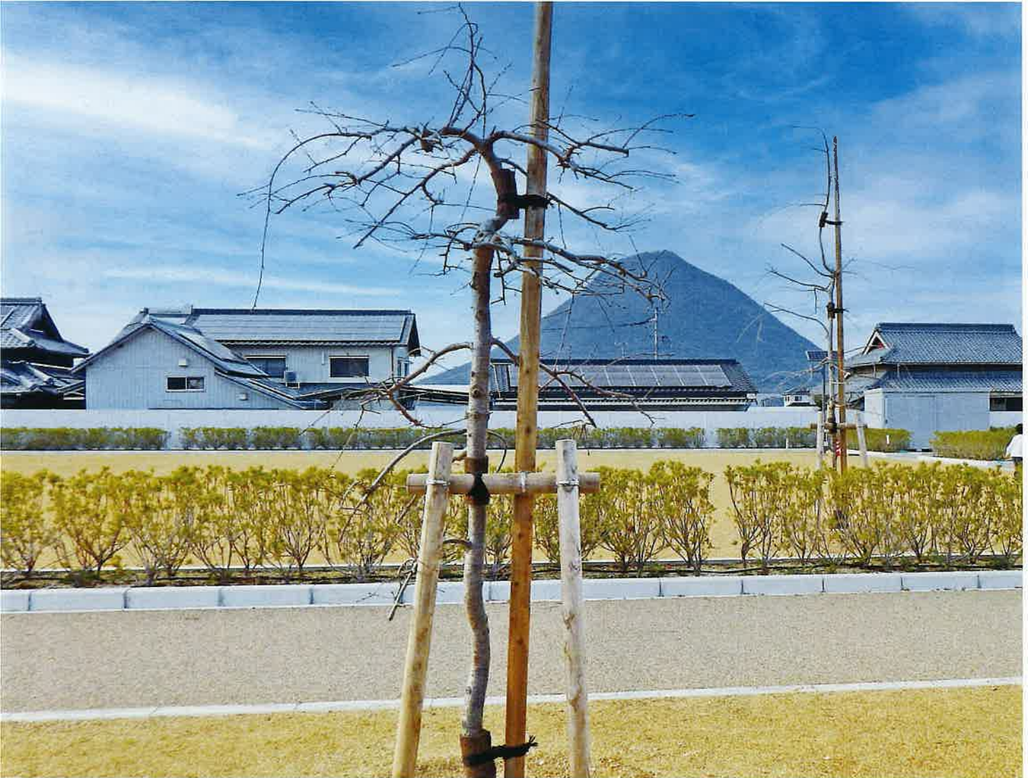
法の郷公園 しだれ桜